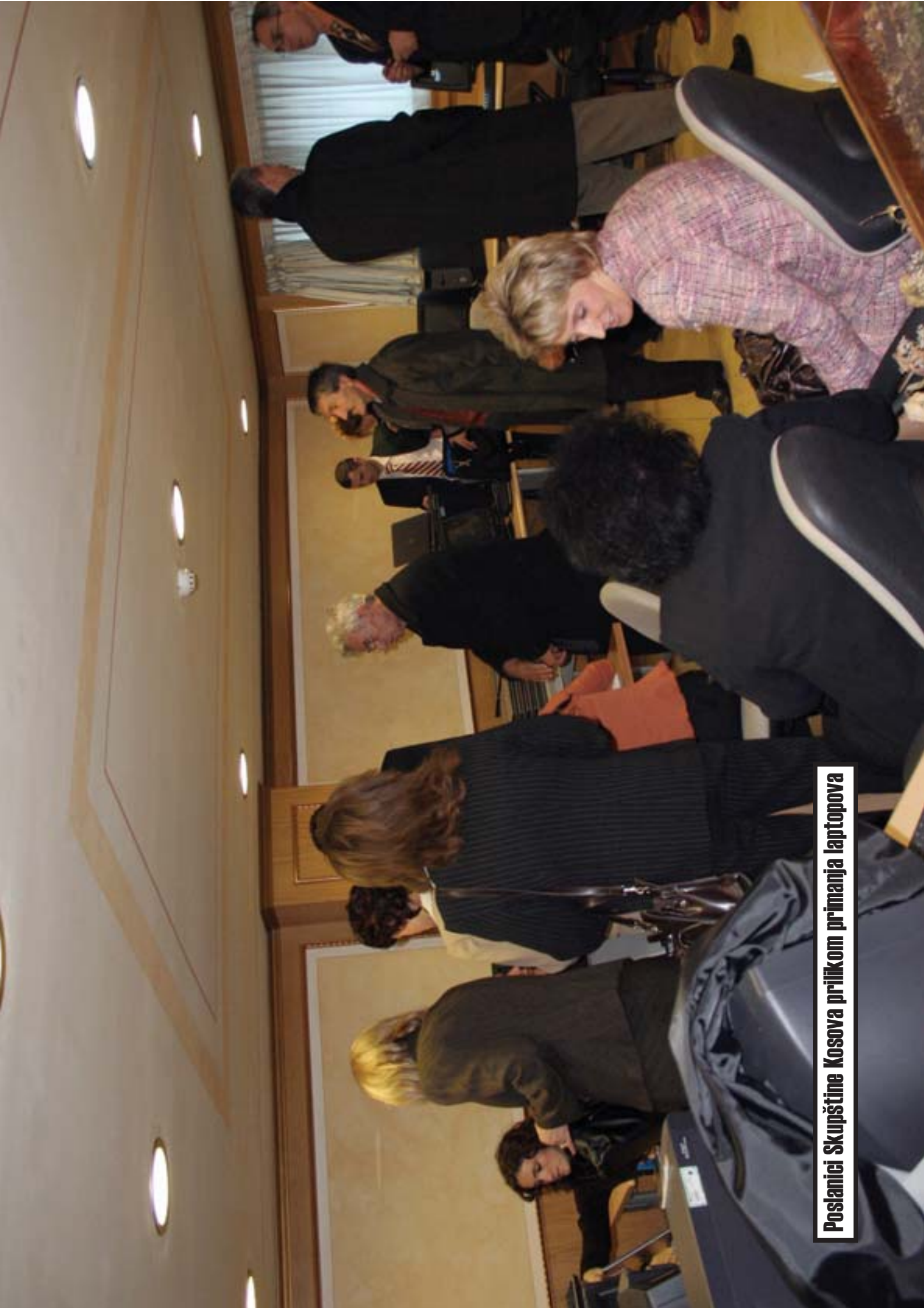
Poslanici Skupštine Kosova prilikom primanja laptopova